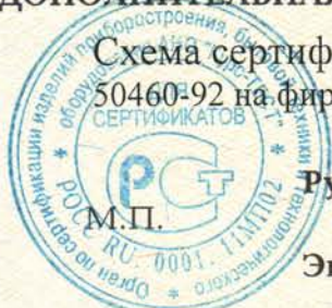
Схема сертификации – За. Продукция маркируется Знаком соответствия по ГОСТ Р 50460-92 на фирменной табличке, в руководстве по эксплуатации, на упаковке.