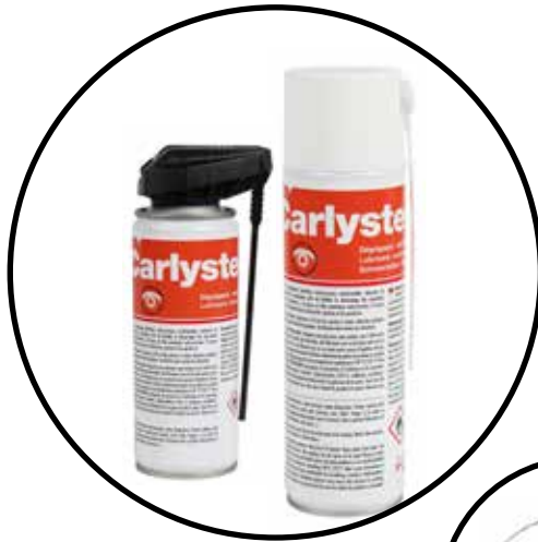
Verlängerung Sprühschlauch für Aerosoldose